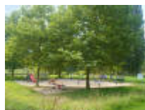
Speelpleintje voor de kleintjes in de Ooidonkdreef