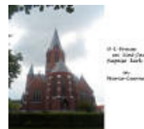
O-L-Vrouw en Sint-Jan Baptist kerk in Maria-Lerne