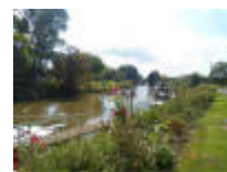
De Leie heeft veel te bieden