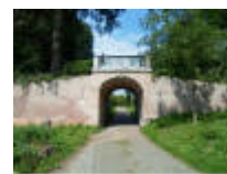
Door het brugje ga je naar de Leiemeersen.