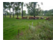
Leiemeersen, hooiland en begrazing