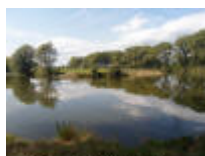
Oude Leie-arm aan Maaigemdijk "Mooie plekje in Deinze"