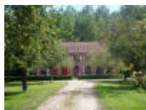
Kapelanij of Klein Ooidonk in de Ooidonkdreef