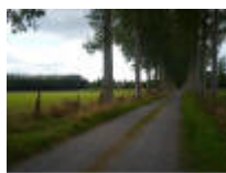
Landbouwweg door de Leiemeersen.