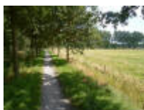
Wandelen langs Maaigemdijk