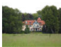
Overkant van de Leie in de Leiemeersen.