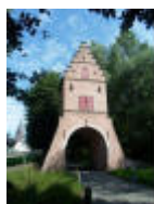
De Blauwe Poort in de Ooidonkdreef