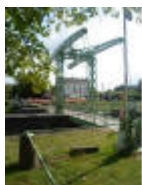
Het Sas en Sashuis in Asene