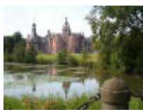
Mooie zicht op het kasteel van Ooidonk