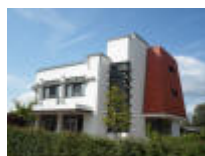
Gebouw in de stijl "Nieuwe Zakelijkheid" (architect De Nil - 1934)