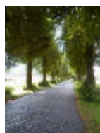
Ooidonkdreef kasseien en oude lindebomen