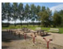
Fietsstalling en rustplaats aan de parking in Ooidonkdreef