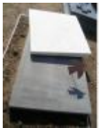
Grafsteen Roger Raveel, met een dwarsliggend wit marmeren vierkant