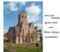
Sint-Jan Baptist, grote kerk voor klein dorpje, Grammene