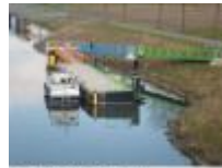
Aanlegsteigers in de Leie voor een bezoek aan Machelen