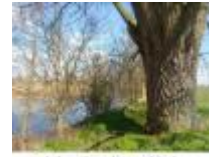
Oude boom langs het wandelpad aan de Oude Leie