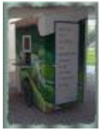
Roger Raveel, één van de grootste kunstenaars van deze tijd