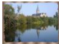
Machelen, prachtige weerspiegeling van de kerk in de Leie