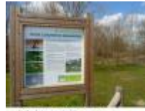
Oude Leiearm in Grammene, een mooi stukje natuur