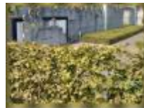
'De Muur Van Verbeelding' (Roger Raveel)