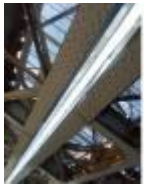
Wandelen onder de Vierendeelbrug, een constructie in vakwerk